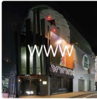
WWW SHIBUYA SPACE SHOWER