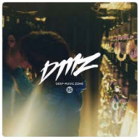
DMZ SPACE SHOWER