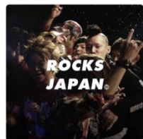
ROCKS SPACE SHOWER SPACE SHOWER