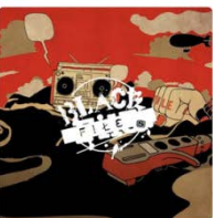
BLACK FILE SPACE SHOWER