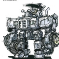
ラフ・コンセプトスケッチ/大河原邦男

また、4月19日(木)には「超越野車戦国ギバギオン」クラウドファンディング開始記念スペシャルイベント」と題して関連イベントを開催予定です。(※詳細は別途スーパーノヴァブックスのSNS、HPで発表)