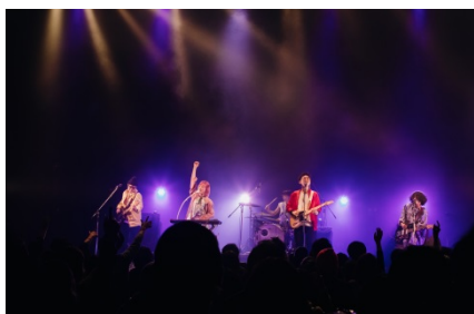
Awesome City Club