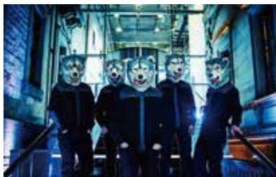
MAN WITH A MISSION